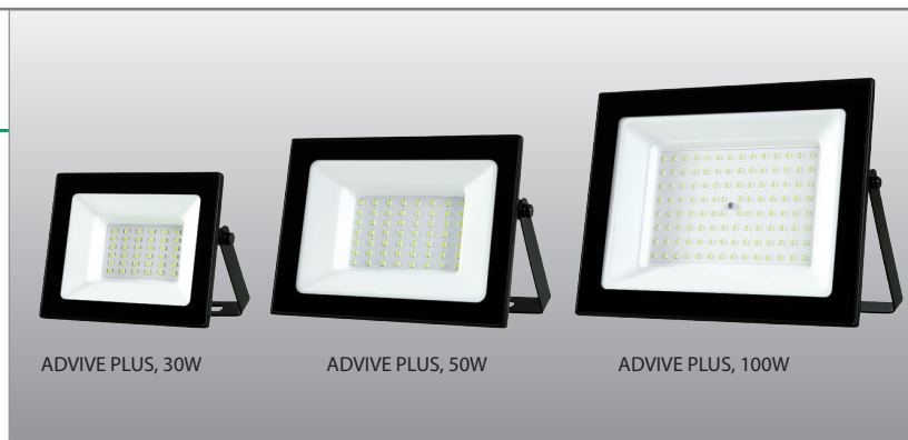
ADVIVE PLUS, 30W