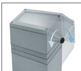
sposób regulacji kierunku świecenia